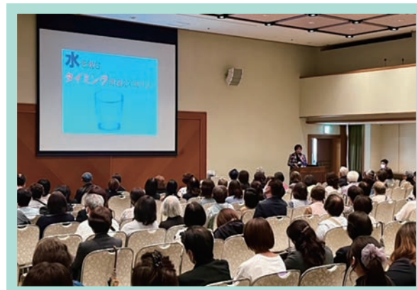
延べ約600名(うちオンライン100名)の方にご参加いただきました。