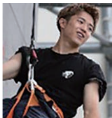
松山市出身 スポーツクライミング 大政 涼選手