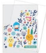
紙製クリアファイル