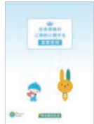
重要事項説明ファイル

新契約締結時にお客さまにお渡しする重要事項説明ファイルを石灰石を原料としたLIMEX(ライメックス)素材に切り替えるとともに、紙製クリアファイルを導入し、脱プラスチックに向けた取組みを推進しています。