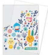
紙製クリアファイル